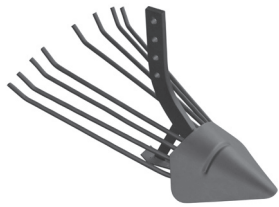
ПЛУГ-КАРТОФЕЛЕВЫКАПЫВАТЕЛЬ ДЛЯ HUSQVARNA TF 338 588 26 63-01