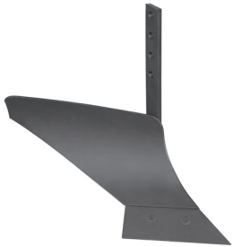
ПЛУГ РАСПАШНОЙ ДЛЯ HUSQVARNA TF 230 588 26 67-01