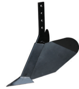
ПЛУГ - ОКУЧНИК ДЛЯ КУЛЬТИВАТОРОВ 588 26 64-01