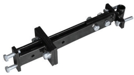
СЦЕПКА ДЛЯ ПРИСОЕДИНЕНИЯ ПРИЦЕПНЫХ АКСЕССУАРОВ КУЛЬТИВАТОРОВ 588 26 60-01